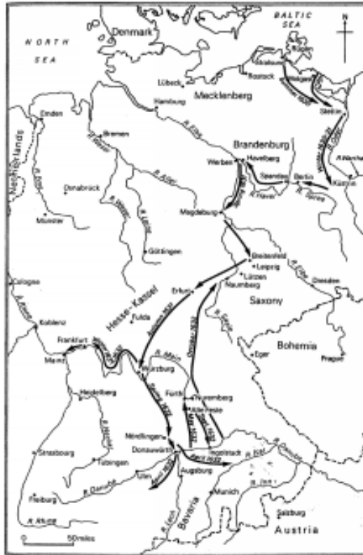
Fig. 2. Gustav Adolfs operationer i Tyskland 1630-32. (Kilde: M. van Crefeld 1960).

Og krig forudsatte nu stående hære – miles perpetuus – en institution, som kun mødte modstand i England: No standing army , lød parolen i presbyterianske kredse (og England indførte som bekendt først værnepligt 1916). Men oprettelsen af stående hære – forskellig fra land til land – stod i tæt forbindelse med etableringen af absolutismen, der på den måde skaffede sig monopol på anvendelsen af 'organiseret vold'