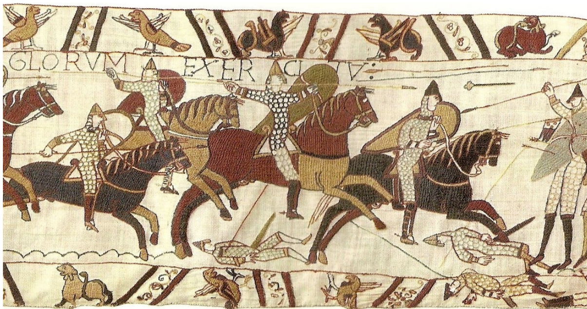
Figur 1. Bayeux-tapetet. Contra Anglorum exercitum (Mod den engelske hær).