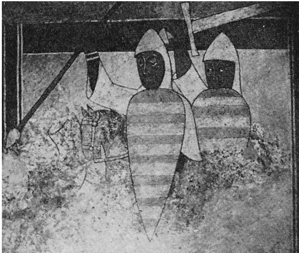
Figur 5. Velle kirke. Kalkmaleri fra omkring år 1200.