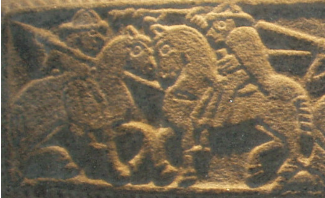
Figur 2. Udsnit af stenrelieffet i Bislev Kirke fra omkring år 1150.