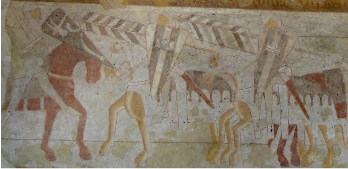
Figur 4. Højen Kirke. Kalkmaleri fra omkring år 1200.